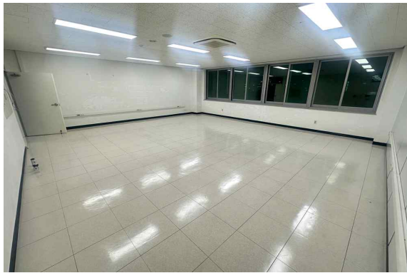
209호 (63.58m 2 )