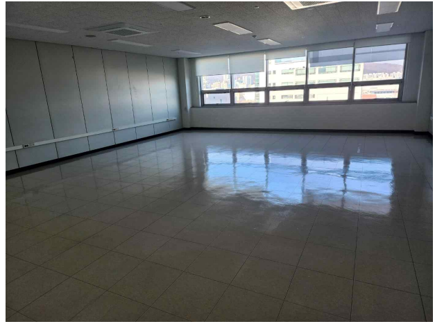
504호 (86.26m 2 )