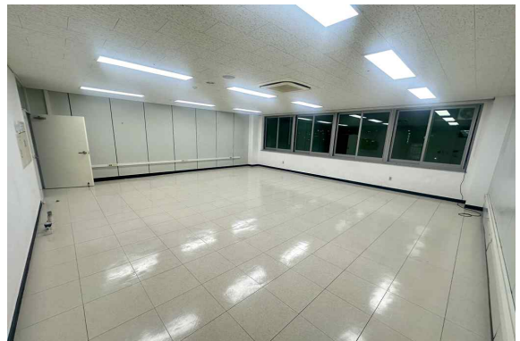
410호 (63.58m 2 )