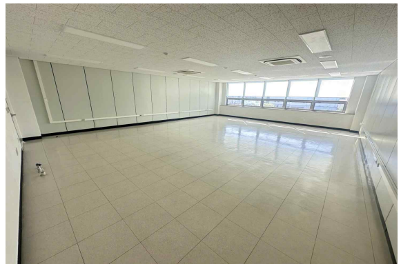
313호 (99.99m 2 )