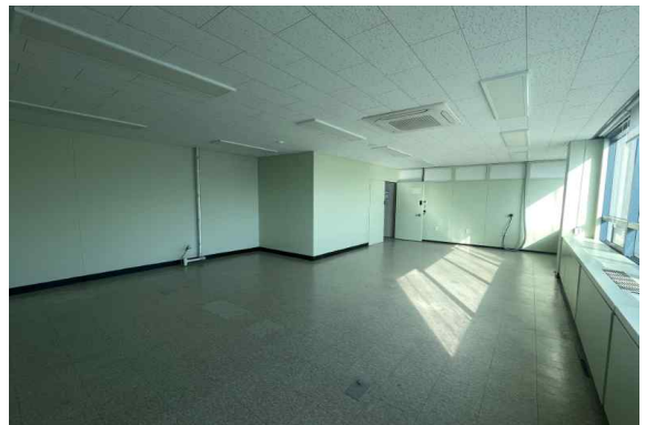
본관 712호 (53.24m 2 )