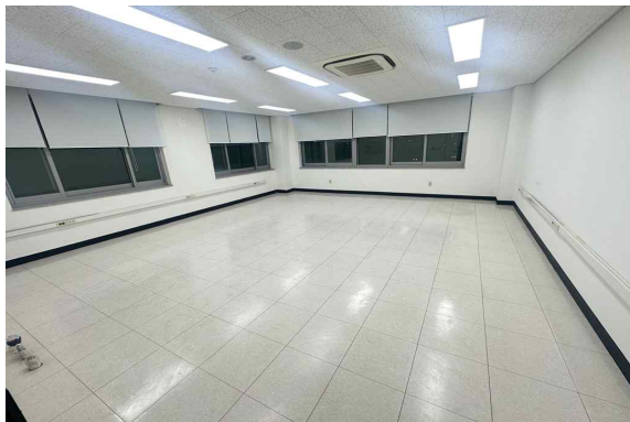
306호 (51.21m 2 )