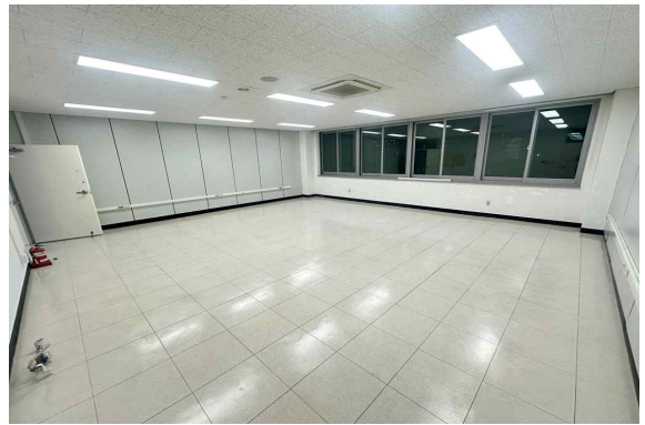
211호 (62.05m 2 )