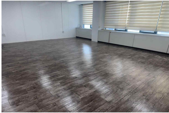
본관 706호 (55.44m 2 )