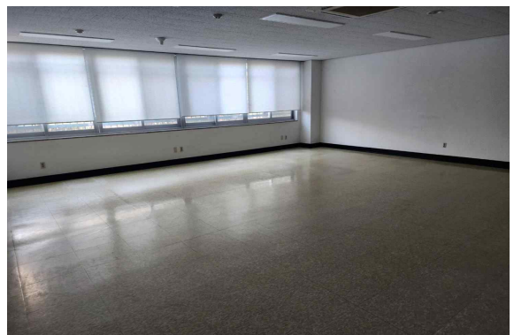
107호 (65.20m 2 )