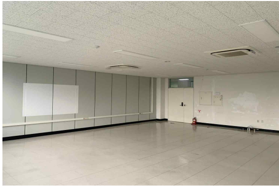
501호 (64.89m 2 )