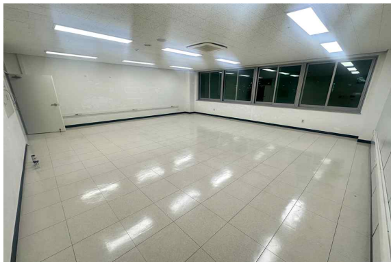
408호 (63.58m 2 )