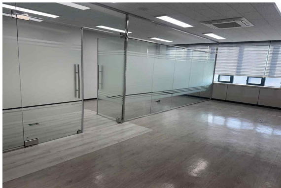
본관 809호 (56.76m 2 )