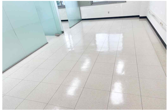
207호 (51.21m 2 )