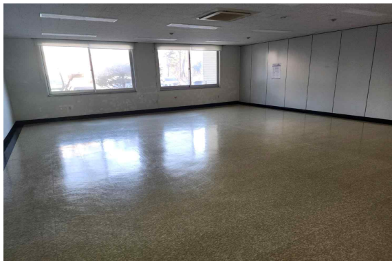
103호 (79.70m 2 )